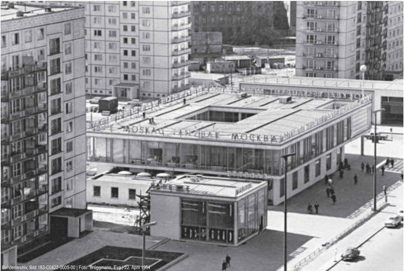
22. April 1964