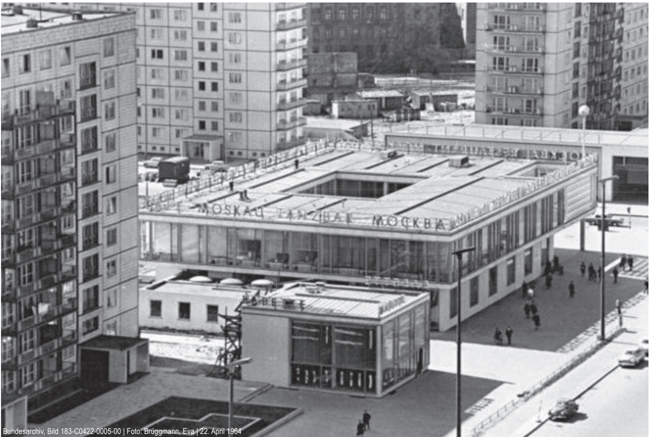
22. April 1964